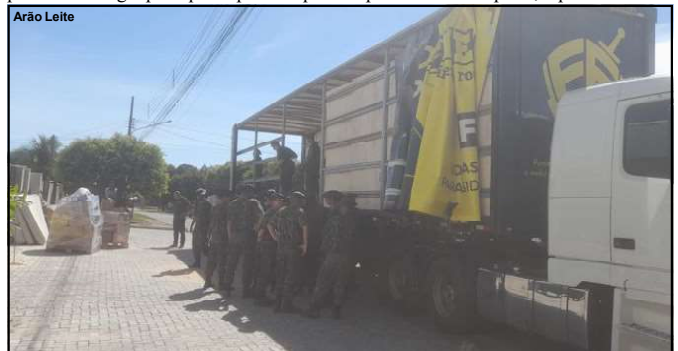
Carreta que saiu de Alta Floresta na quinta-feira direto para o Rio Grande do Sul

ainda querem ajudar, possam enviar valores direto para as contas, e assim as famílias afetadas pelas chuvas já compram os produtos lá também, ajudando o comércio do Rio Grande do Sul que está tentando retomar as atividades e precisa muito do apoio”, explicou.