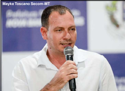
Prefeito Cezar Perigo, do município de Nova Bandeirantes, agradece apoio do governo Mendes