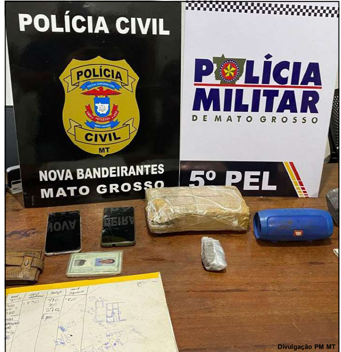
Droga e caderno do tráfico foram apreendidos

A motocicleta sem placa foi retirada e apreendida, foram encaminhados à Delegacia de Polícia Civil.