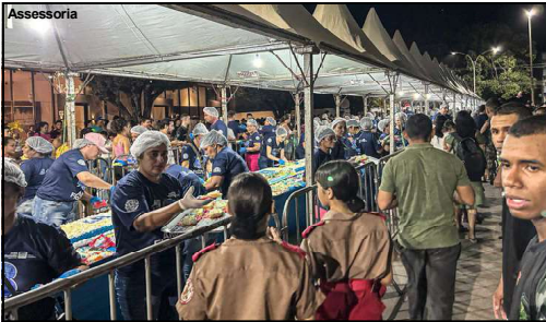
Bolo de 48 metros servido à população de AF