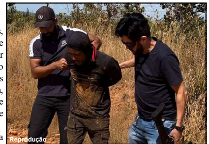
Criminoso foi pedir carona logo para agentes de segurança

Policiais civis seguiram em um veículo descaracterizado e viram as pegadas do