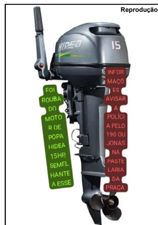
Motor furtado é ano 2020

O motor Hídea é cinza, 15 HP ao e modelo 2020.