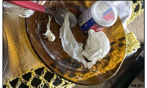
Vestígios de uso de cocaína na casa

A prisão dos dois foi quando a Polícia Militar diligenciava para encontrar o suspeito de um roubo. Naquela ocasião, no bairro Primavera, uma mulher de 43 anos denunciou que um homem magro, alto, usando capacete preto, invadiu sua casa e, armado, roubou um cofre contendo 500 reais. O crime aconteceu em plena à 13 horas.