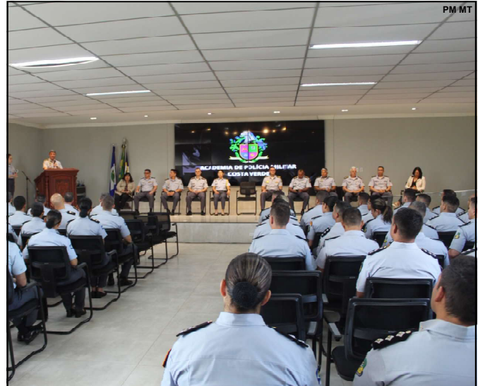
Alunos passarão por um intenso preparo e qualificação para assumirem ao posto de Oficial de Estado-Maior

na qualificação, preparo e somos referência no país pelo trabalho de policiamento ostensivo e tático”, finalizou o comandante.