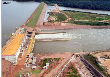
Usina Hidrelétrica de Colíder em Mato Grosso