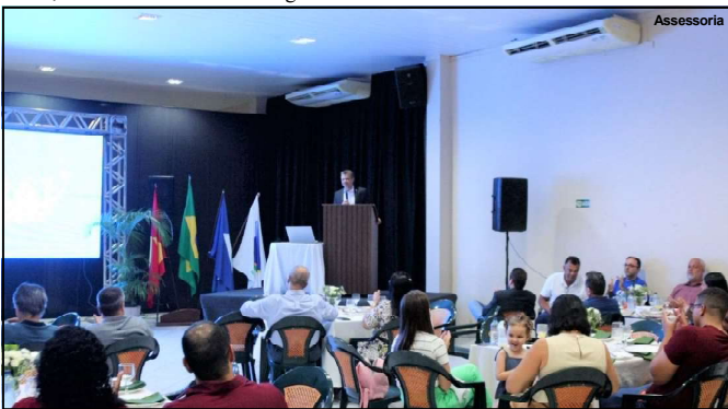
Evento realizado na noite de 17 de maio em Alta Floresta

“O Programa SER Família Mulher nasceu com a finalidade de fomentar políticas públicas, oferecer auxílio financeiro e fortalecer a rede de proteção às mulheres vítimas de violência doméstica. Somente com a união de esforços vamos conseguir alcançar sucesso nas ações implementadas. A Expedição será uma importante ferramenta para expandir as ações de combate aos crimes de violência e feminicídio”, explicou.