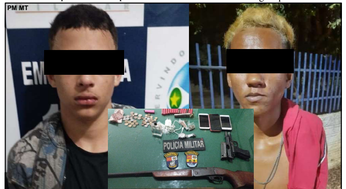
Infratores que estavam armados ainda foram socorridos, mas não resistiram