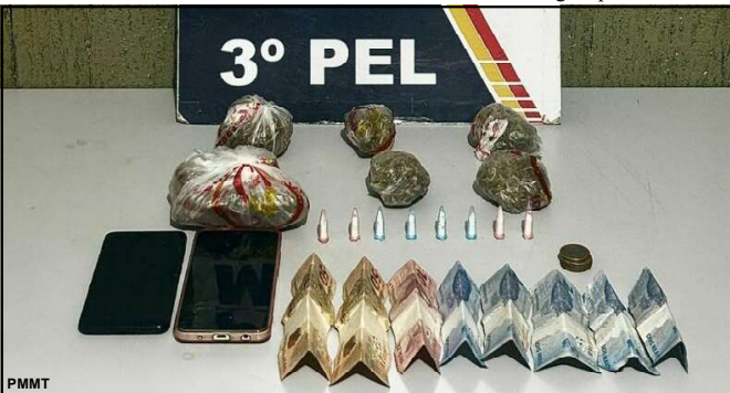
Porção grande de maconha, várias médias e cocaína, além de dinheiro

O caso será investigado pela Polícia Civil.