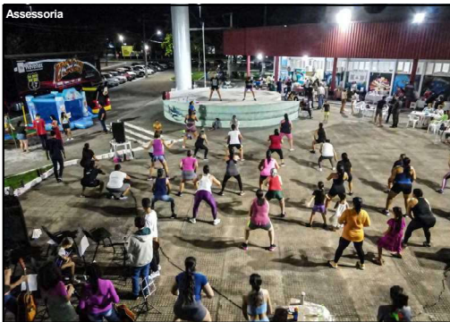
Evento movimentou praça da cultura em AF

Além de ser um espaço de lazer e diversão para as famílias, a Varanda também é uma “vitrine” para os artesãos da cidade, que utilizam o espaço para comercializar