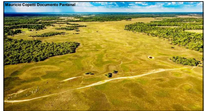
Mauricio Copetti Documento Pantanal

Já no Pantanal, a proibição se estende até 31 de dezembro.