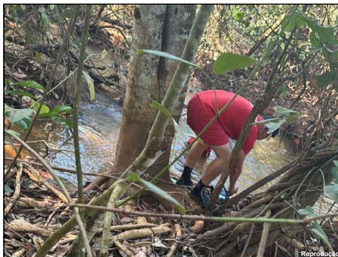
Área onde o corpo da vítima foi localizado

Giovanni foi atraído a uma residência e depois levado a uma área