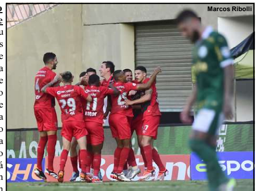
Athletico vence fora de casa e mantém liderança

O Athletico chegou a quarta vitória em seis jogos disputados nesse Brasileirão, a campanha conta com um empate e apenas uma derrota, o que credencia a equipe de Curitiba ao topo da tabela de classificação com 13 pontos, a mesma pontuação do Bahia, a diferença está nos saldos de gols em que o Athletico tem melhor desempenho.