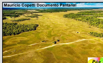
Mauricio Copetti Documento Pantanal

Desde o início da estação chuvosa, em outubro, é observado um déficit de chuvas na Bacia do Rio Paraguai