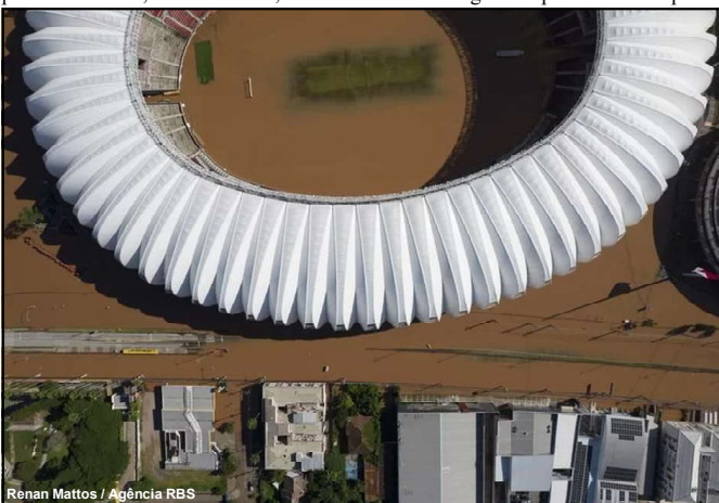
Estádio Beira Rio está tomado pela água

A problemática não está na Arena Barueri, e sim no impedimento de se usar o Allianz pela empresa que administra o estádio contratualmente até 2044. A W Torre tem sua maior fonte de renda na locação do estádio para grandes shows, quando se realizam esses eventos o Palmeiras fica impedido de usar sua própria casa além do desgaste do gramado artificial. O problema está longe de ser solucionado e o Palmeiras ou terá que se adequar a atual solução ou de fato encontrar outro plano para voltar a se sentir em casa.