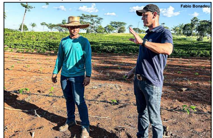
Técnico orientando produtor no município de Alta Floresta

Durante o evento, serão realizadas palestras abordando os desafios e soluções para o combate ao desmatamento na Amazônia, o turismo como forma de conservação da região, questões relacionadas à agricultura familiar e à integração lavoura-pecuária-floresta, além de uma palestra jurídica sobre ocupação sustentável e direitos dos povos tradicionais.