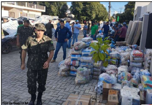
Tiro de Guerra AF

Volume de doações surpreende e organizadores chamam mais voluntários com caminhões