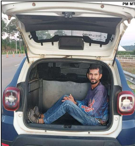
Homem preso na MT-208 tinha mandado de prisão em aberto

busca-lo quando detido. “A gente não sabia que ele tem pendências com pensão. Ele havia nos dito que já tinha resolvido tudo com a mulher, mas aí deu nisso”, comentou o homem no quartel da PM quando foi resgatar o veículo.