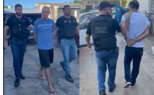
Polícia Civil montou cerco e capturou suspeitos