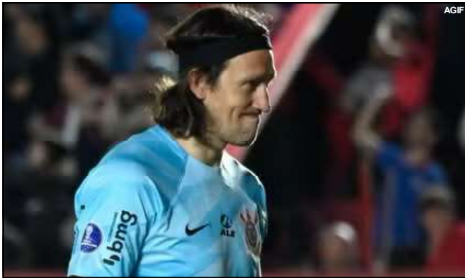
Cássio lamenta gol do Argentino Juniors

O Dourado volta a campo no sábado, quando estreia dentro de casa no Brasileiro. Lanterna da Série A, o Dourado recebe o Atlético-MG, às 17:30 horas (de MT), na Arena Pantanal.