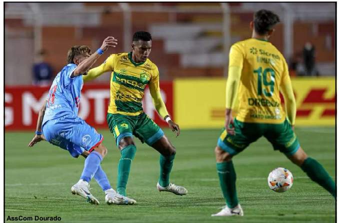
Cuiabá empata na altitude