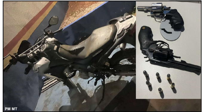
Moto e armas usadas por bandidos em assalto em Alta Floresta

Polícia Militar ao receber a informação esteve isolando o local até a chegada da Polícia Civil e Polícia Técnica que coletaram dados no sentido de apurar impressões digitais e saber se há outros envolvidos no crime.