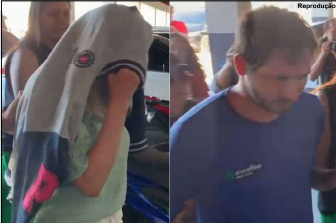
Mulher e médico estavam escondidos em propriedade da família

O caso segue investigado pela Polícia Civil.