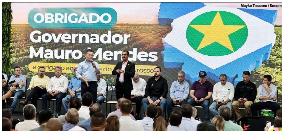
Mayke Toscano / Secom

Em Sinop, Mauro Mendes destacou a política de tolerância zero às invasões de terra