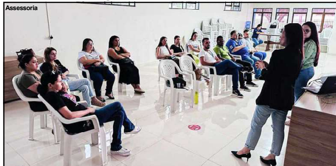
Encontro de profissionais da saúde qualifica equipe no município

E os números refletem isso. Nos últimos três anos, foram realizados 62 mil atendimentos individuais, sendo 14.963 em 2021, 20.834 em 2022 e 26.593 em 2023. Segundo o Ministério da Saúde, a Saúde Bucal é responsável pelo cuidado contínuo e atua na Atenção Primária à Saúde. Esses profissionais são encarregados de realizar ações de promoção, prevenção, diagnóstico, entre outros serviços, sempre visando à saúde bucal dos usuários do Sistema Único de Saúde (SUS).