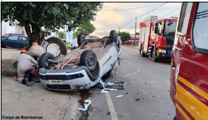
Corpo de Bombeiros

De acordo com a dona de casa e testemunhas, o fogo começou no quarto, mas não se sabe como. Pode ter ocorrido uma pane elétrica, mas somente a perícia deverá apontar a causa.