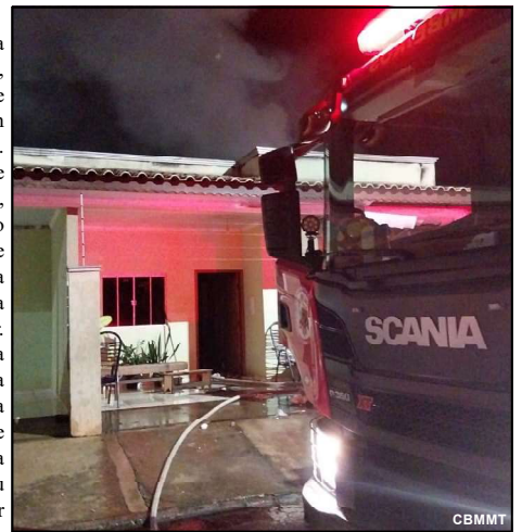
Corpo de Bombeiros evitou que fogo se alastrasse