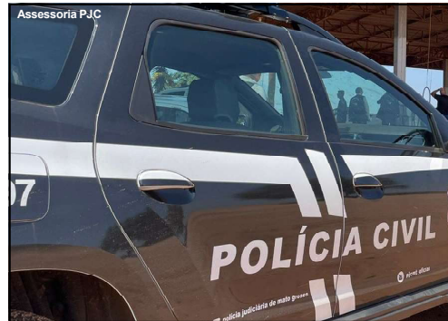
Operação da Polícia Civil cita também um investigador e o sobrinho de ex-governador de Mato Grosso

Com a operação, a Polícia Civil de Mato Grosso, por meio da Corregedoria-Geral, demonstra o caráter republicano em garantir a integridade pública da instituição,