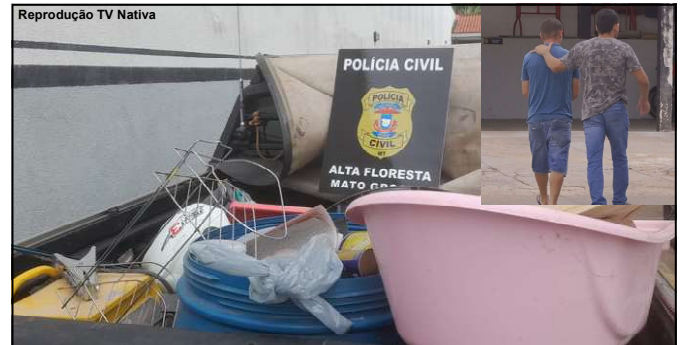
Produtos recuperados suspeito conduzido à Delegacia em Alta Floresta

As vítimas foram conduzidas ao pronto socorro do Hospital Regional de Alta Floresta onde ficaram aos cuidados médicos.