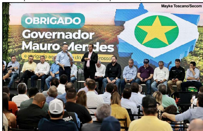
O governador Mauro Mendes, durante discurso na Norte Show

“Não tenho dúvida que nós estamos construindo um dos mais belos estados dessa nação, e muito disso é mérito dos nossos produtores rurais, trabalhadores do campo, que estão mostrando a força do nosso agronegócio. Com trabalho sério e fé em Deus, continuaremos crescendo, arrecadando corretamente os impostos e aplicando esse dinheiro em obras e ações que vão melhorar a infraestrutura, o ir e vir, e a qualidade de vida da população. Mato Grosso é hoje um exemplo de Brasil que dá certo”, finalizou.