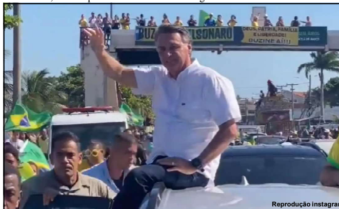
Jair Bolsonaro que no início do mês já visitou Cuiabá e outras cidades, agora oficializará estadia em Sinop

A última passagem do ex-presidente causou grande comoção por onde esteve e recebeu críticas de aliados em vídeo no qual tem os pés lavados e ungidos por evangélicos.