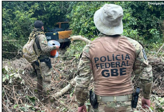
Ação da Polícia Federal contra crimes ambientais

Encerradas as atividades em campo, as investigações terão continuidade para identificar os financiadores das atividades ilegais e descapitalizar a organização criminosa que, ao usurpar de ouro de origem ilegal, financia diretamente a degradação do meio ambiente, dizima a população indígena na região e polui os rios que abastecem os Municípios, gerando, conseqüentemente, enormes danos econômicos, sociais e ambientais.