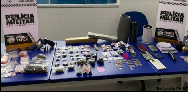
Droga apreendida em Alta Floresta pela PM

Polícia Militar através da Força Tática executou ação com prisão de três