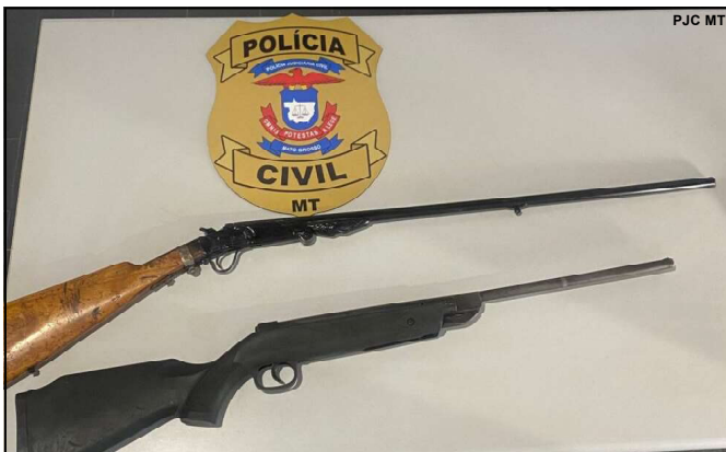
Espingardas apreendidas pela Polícia em Mato Grosso