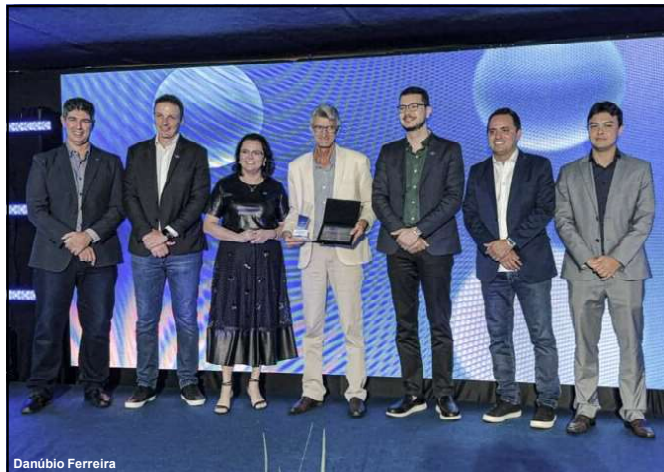
Prefeito e equipe do programa receberam o prêmio no Centro de Eventos Pantanal, em Cuiabá

sustentabilidade. Quero aproveitar este momento para agradecer aos padrinhos e adotantes, vocês acreditam nessa iniciativa e, juntos, estamos transformando Alta Floresta e tornando nossa cidade uma referência".