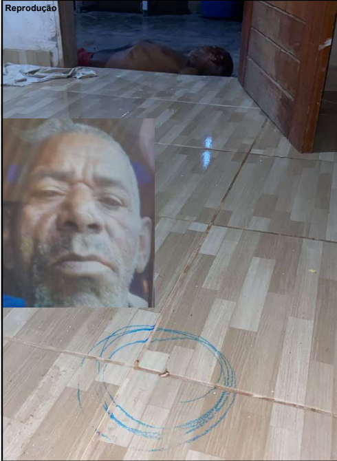
Perícia fez coleta de material no local do crime

Por Arão Leite Alta Floresta – Um homem de 64 anos foi executado com vários tiros de pistola no peito, braço e cabeça. O assassinato aconteceu na noite de segunda-feira na Rua Regina Pereira, bairro Vila Rica, município de Alta Floresta. Uma testemunha acordou com o barulho dos tiros, mas não viu os atiradores que saíram correndo após o crime.