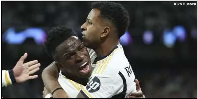
Vinicius e Rodrygo mais uma vez como destaques

gols contra equipes inglesas na Champions. Sete gols dele mesmo mais nove assistências, tudo no mata-mata. O Manchester City agora recebe o Real Madrid no Etihad Stadium no próximo dia 17 de abril em Manchester.