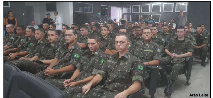
Atiradores do TG 09 001 acompanharam votação de matéria no Legislativo

Conforme a decisão judicial da época, o criminoso relatou que não aceitava a intenção da ex-companheira em romper o relacionamento e também quis se vingar porque ela, supostamente, denunciou a mãe dele por levar drogas ao filho no presídio.