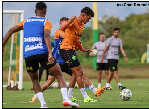
Cuiabá encerra a preparação para jogar a Sul-Americana

Cuiabá, vai até na Caracas enfrentar o Metropolitanos nesta quinta-feira, 11/04, Copa Sul-Americana, pela 2ª rodada. Os times vão a campo no gramado do Olímpico de la UCV a partir de 19:00h. O Metropolitanos chega para essa partida com 1 vitória e 4 derrotas nos últimos cinco jogos. Do outro lado, o Cuiabá vem de uma série de 4 vitórias e 1 empate.