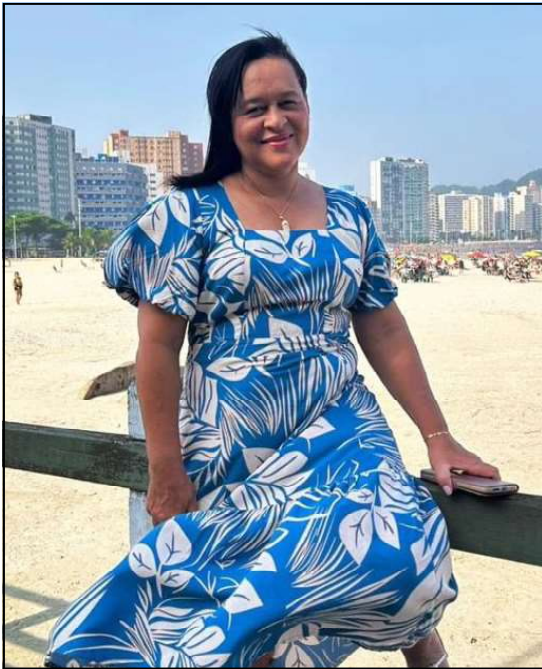
Maria Bethania curtindo o lado bom da vida!