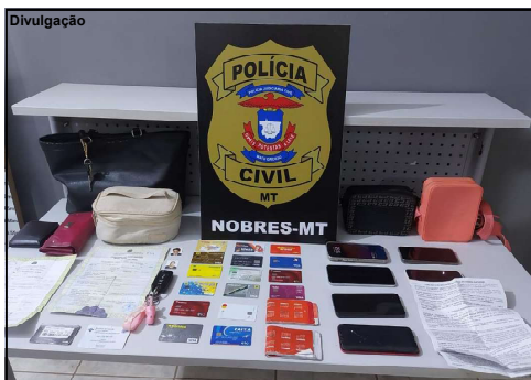
Cheques, cartões de créditos e documentos falsos apreendidos com golpistas