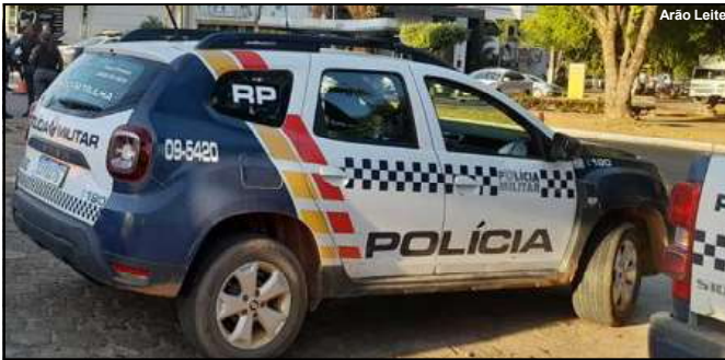
Bandidos saíram sem levar nada e caso foi registrado pela PM em AF

Bandidos armados renderam e torturaram caseiro querendo dinheiro e objetos de valor