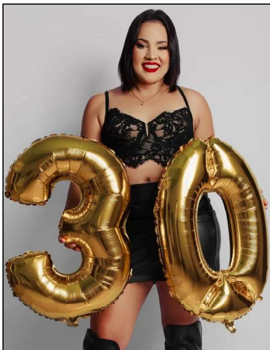
Dandara exalando beleza e poder no ensaio de 30 anos!