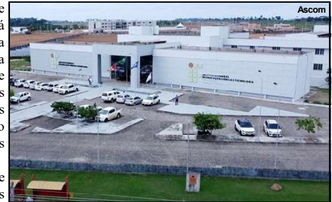
Unidade do IFMT no município de Alta Floresta

Inovação em Serviços Públicos disse que ocorreu um reajuste de 9% para todos os servidores, assim como um aumento de 43,6% no auxílio alimentação. A pasta afirma que a discussão sobre o reajuste deste ano é debatido desde o semestre passado.