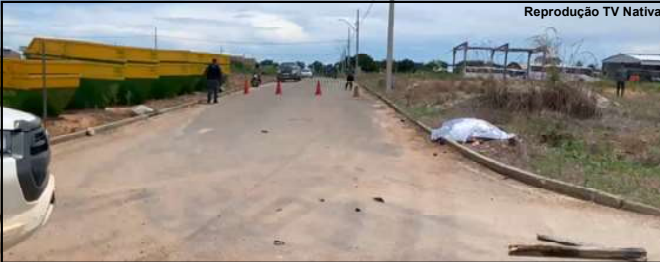
Avenida Brasil foi o cenário do trágico acidente nesta segunda-feira