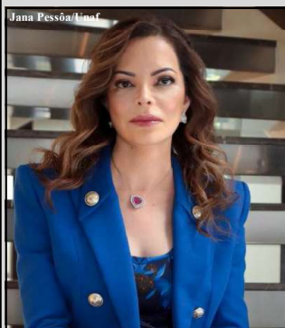
Virginia Mendes é economista, empresária e primeira-dama de MT