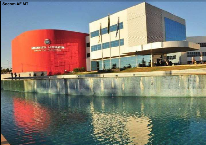
A medida é reflexo de uma decisão do plenário do STF, que, na semana passada, derrubou trechos das Constituições de Mato Grosso e de Pernambuco