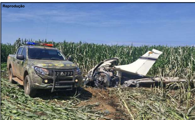
Grupo Especial de Fronteira em mais uma ação bem sucedida

Apreensão foi feita no âmbito da Operação Protetor das Fronteiras e Divisas, que atua no combate o tráfico de drogas e outros crimes na fronteira