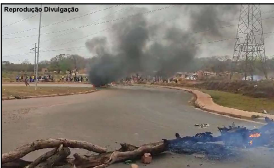
Articulação acontece após conflitos ocorridos no estado

A Câmara Setorial quer evitar conflitos e truculência por parte das Forças de Segurança