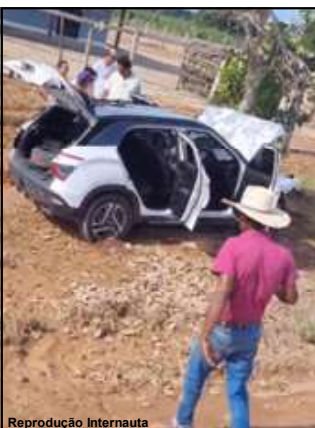
Veículo com frente destruída após bater em caminhonete e árvore

Situação foi registrada na Rodovia MT-208, em frente a antiga Alta Leilões em AF