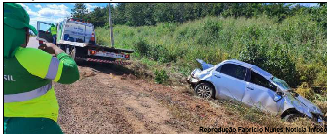
Carro praticamente destruído em capotamento domingo

A motorista contou que tudo aconteceu em um momento de distração, que foi olhar para trás e ao retornar perdeu controle do volante e o carro capotou. Não há relato de ferimentos graves em nenhuma das vítimas, apenas danos materiais.