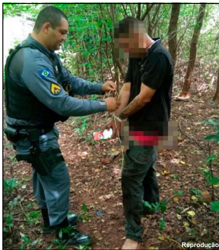
Polícia resgatou vítima que estava amarrada dentro da mata