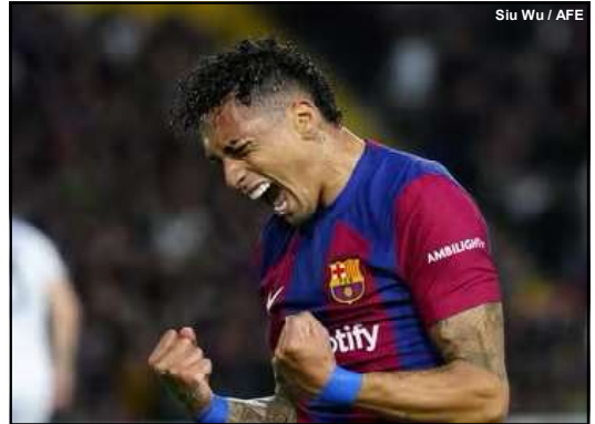
Siu Wu / AFE

Convocado por Dorival Júnior para defender a seleção brasileira na próxima data Fifa, Raphinha foi importante para a construção do placar positivo. Primeiro, ele deu assistência para Fermín López bater de