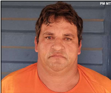
Suspeito foi preso após PM descobrir seu paradeiro em Monte Verde Por Arão Leite Alta Floresta – Foi preso na cidade

Suspeito de 45 anos era considerado foragido da Justiça e sua captura foi feita pela PM