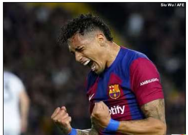
Siu Wu / AFE