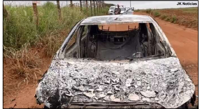
Combate ao tráfico de drogas

Diante das diligências ininterruptas a partir da localização do corpo da vítima, os três foram presos em flagrante e