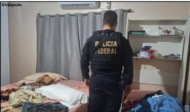
Operação Vulnerable resultou na prisão de pedófilo