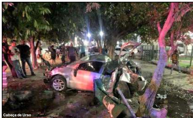
Cabeça de Urso

assumiram o controle do carro e, durante a fuga, na avenida Fernando Corrêa da Costa, se envolveram em um grave acidente, resultando na derrubada de uma árvore e de um