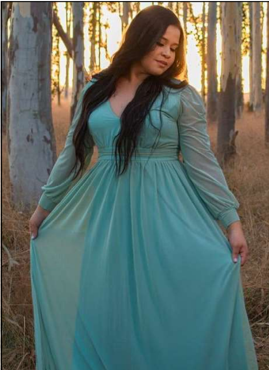
Thafnes toda elegante faz pose para foto!