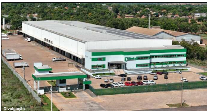
Feira de negócios tem objetivo de estimular construção civil