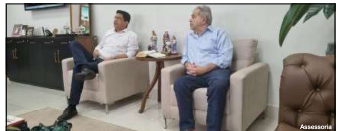
PSDB quer vaga de vice