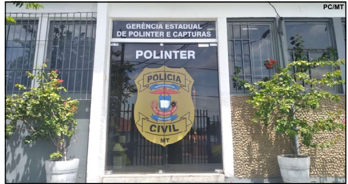
Ação da Polícia Civil resulta em capturas

As condutas delituosas eram registradas pelo criminoso, que guardava