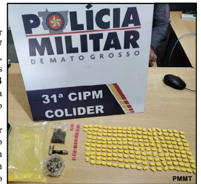
Droga sintética foi recolhida pela PM

Nas buscas pelo local, os militares encontraram um pacote contendo 204 comprimidos de ecstasy e uma porção de substância análoga a maconha.