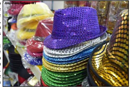
Produtos carnavalescos devem ser adquiridos em lojas especializadas, recomenda Procon

Viagem de ônibus: em caso de atraso de uma hora ou mais, o passageiro pode exigir a restituição do valor do bilhete ou pedir um serviço equivalente para o mesmo destino. Se o atraso ou a interrupção da viagem forem culpa da empresa de ônibus e ultrapassarem 3 horas, o consumidor tem o direito de receber alimentação. Se a viagem não prosseguir no mesmo dia, a empresa deve fornecer