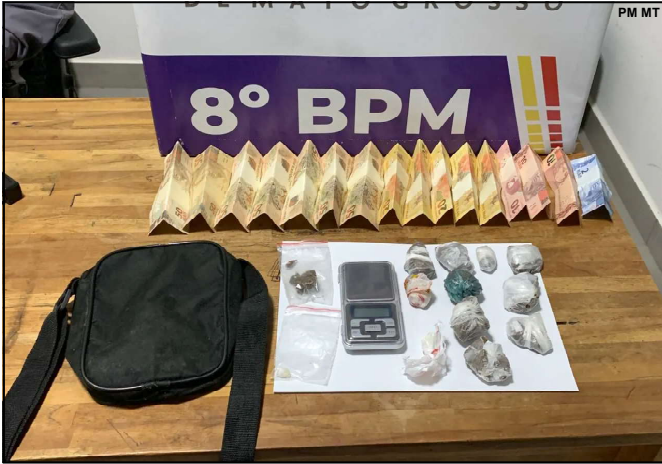
Droga apreendida pela PM em Alta Floresta

Na mesma ação da PM, um menor foi apreendido por uso de droga