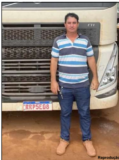
Homem de 43 anos foi liberado após 24 horas na região de Marcelândia

Caminhoneiro trafegava sentido a Sinop (503 km ao norte de Cuiabá). No entanto, por volta das 11h, a empresa responsável identificou que o veículo de carga havia saído da rota programada. Um funcionário entrou em contato com o motorista, que informou que a carreta havia