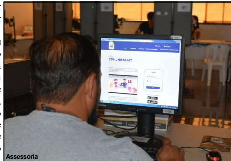
Programa Nota MT já premiou milhares de pessoas

www.nota.mt.gov.br ou aplicativo. Na hora do cadastro também é indicada a instituição filantrópica a qual o consumidor pretende ajudar. A instituição, porém, precisa ser cadastrada junto à Secretaria de Estado de Assistência Social e Cidadania (Setas). Caso o consumidor seja sorteado, a entidade ganha o