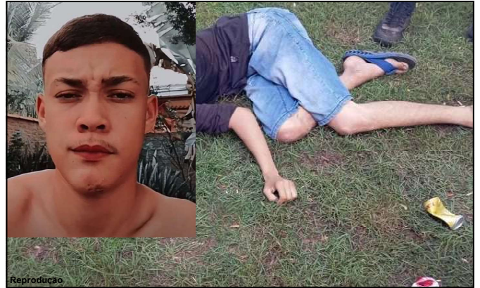
Jovem foi executado em festa em Nova Monte Verde

O caso é investigado pela Polícia Civil de Nova Monte Verde