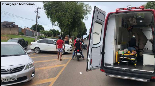
Acidente aconteceu na tarde de sábado, dia 20

Vítima de 18 anos foi socorrida pelo Corpo de Bombeiros