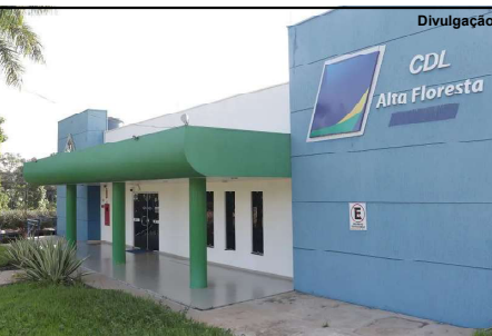
Entidade no município de Alta Floresta está sob intervenção desde o início do ano de 2024

Esta intervenção tomou-se necessária devido à