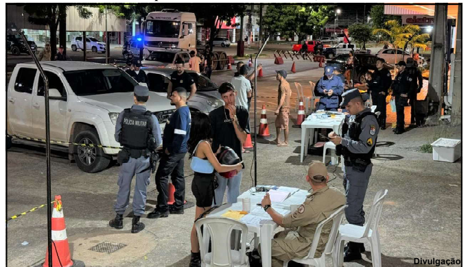
Na operação Lei Seca o foragido e outros condutores foram presos

Jovem de 24 anos apresentou outro documento, mas não adiantou