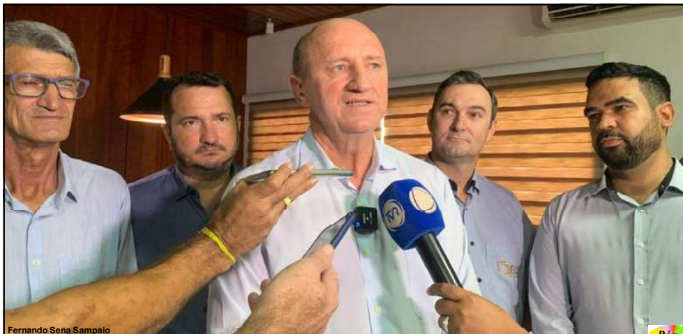
Fernando Sena Sampaio

Ex-ministro e ex-deputado federal, progressista é secretário de política agrícola do governo federal