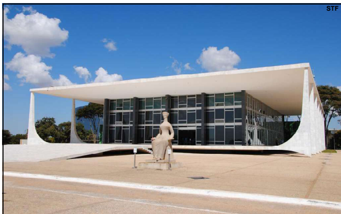
A decisão foi dada após reunião do governador Mauro Mendes com o chefe de gabinete do ministro, Rodrigo Hauer, em Brasília

André Mendonça vai ouvir representantes de instituições sobre o tema