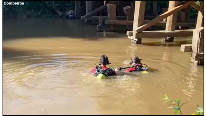
Corpo de vítima foi encontrado por bombeiros, a três metros de profundidade, amarrado e com pesos para não emergir

Com todas as informações a Polícia Civil acionou o Corpo de Bombeiros em Alta Floresta para o resgate. E em pouco