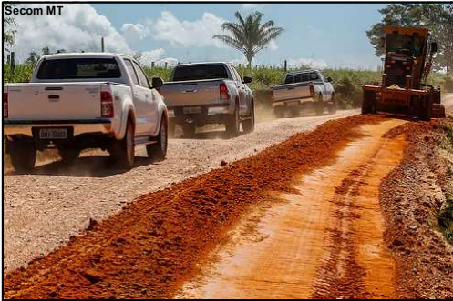
Rodovia em AF de acesso ao Rio Teles Pires

No último dia 12 de janeiro, a SINFRA – Secretaria de Infraestrutura de Mato Grosso publicou ata de realização de licitação para a contratação de empresa de engenharia para execução da obra de Implantação de Pavimentação da MT-325, trecho da MT-208 em Alta Floresta ao limite MT/PA, com extensão de 39,96 km, o trecho liga a região do porto de areia.