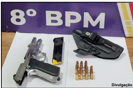
Arma apreendida foi encaminhada à delegacia em Alta Floresta

Ação da Polícia Militar foi na Rodovia MT-208, em Alta Floresta