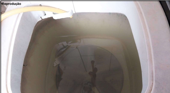
Água que chega ao consumidor é suja em Alta Floresta

Empresa responsável fala em investimentos e manutenções, mas consumidores reclamam