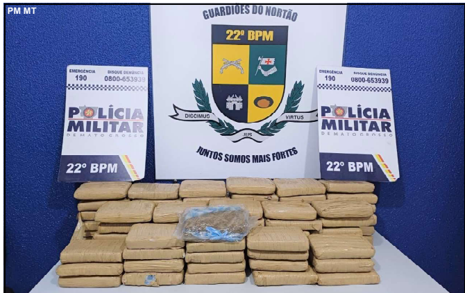
Carregamento de maconha foi interceptado pela Polícia de Mato Grosso

Suspeitos foram conduzidos com a droga para Delegacia de Peixoto de Azevedo