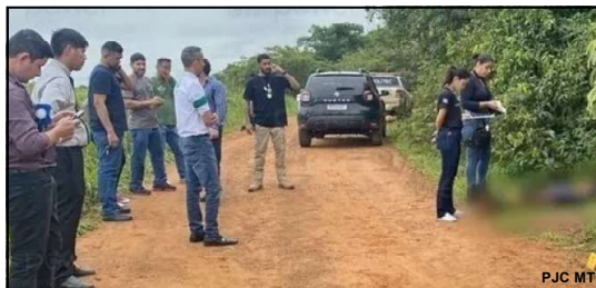
Corpo encontrado em beira de estrada na cidade de Sorriso