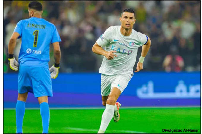
Cristiano Ronaldo é o melhor marcador mundial em 2023

Cristiano Ronaldo ultrapassou nesta terça-feira o centroavante Harry Kane, do