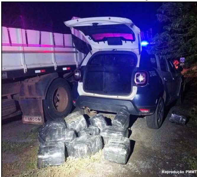
Droga apreendida pela Polícia de Mato Grosso

Boletim de ocorrência foi registrado e o caso será investigado.