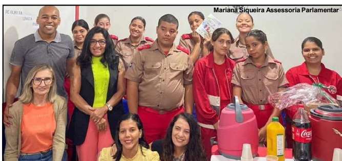
Vereadora com professores e alunos do projeto

Evento foi realizado na Escola Militar D. Pedro II Vitória Furlani da Riva