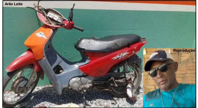
Moto de vítima de acidente ficou praticamente destruída

estavam de motocicleta transitando na noite de 24 de dezembro pela Avenida Castelo Branco no Bairro Cidade Bela quando atropelados por uma caminhonete Hilux.