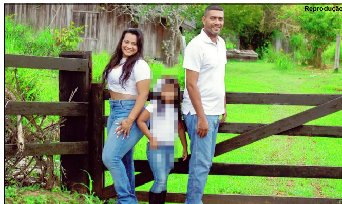
Veterinário após o crime ainda pediu para testemunhas acionarem Samu, mas vítima não resistiu e ele foi preso

Polícia também foi acionada e, no local,