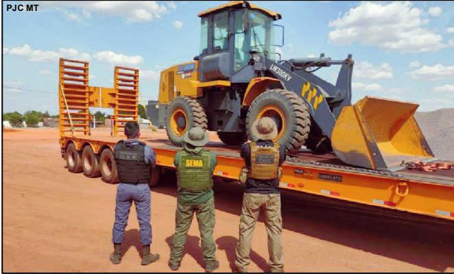
Ação integrada resultou também em apreensões