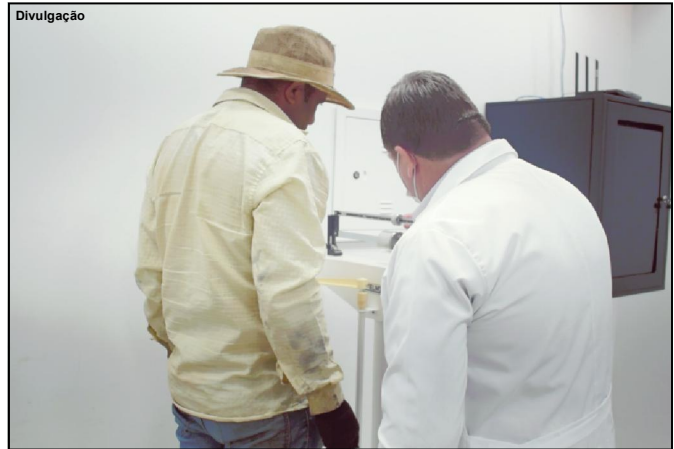
Programa tem atingido resultado positivo

explica que as substâncias do tabaco e a nicotina são nocivas à saúde. “São substâncias que causam a dependência física, psicológica e comportamental”, alerta. De acordo com o Ministério da Saúde, em 2019, o percentual de