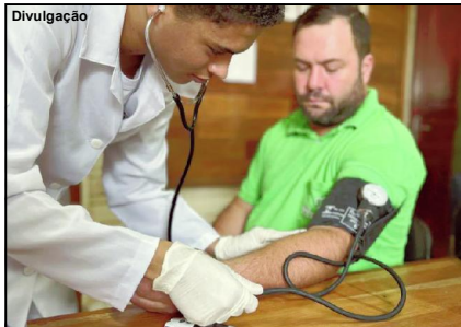
Servidores da base florestal atendidos no campo de atuação em AF