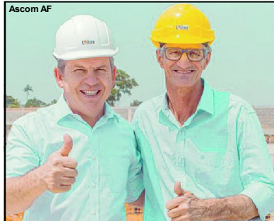
Governador Mauro Mendes e prefeito Chico Gamba na obra do Hospital Regional

Mas, os investimentos do Governo do Estado vão além do setor de infraestrutura. Também podemos citar o apoio ao Festival da Canção de Alta Floresta (FESCAF), que recebeu R$ 50 mil. Também foram destinados R$ 250 mil na implementação cenotécnica do Teatro Agostinho Bizinotto. Na