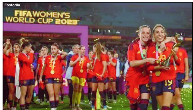
Jogadoras da Espanha após conquista do Mundial

Nilton Santos pelo jogo de ida da fase de quartas de final.