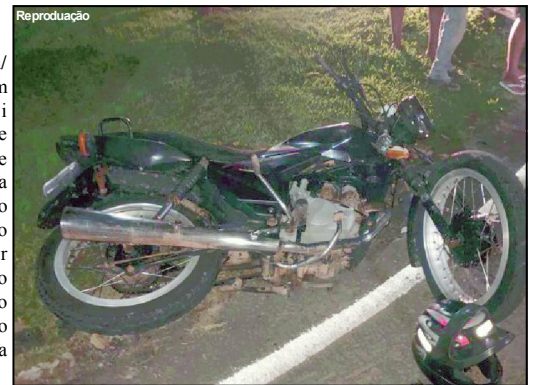
Moto do jovem atendido em estado grave após acidente

Alta Floresta/MT – Um jovem de 26 anos foi vítima grave de um acidente ocorrido na Avenida Paulo Pires, cruzamento com Rua Aldenor Alves Freire, no Setor G, região central do município de Alta Floresta.