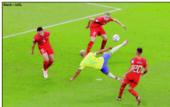
Richarlison acerta lindo chute em vitória do Brasil

fossem volantes e iniciavam a construção das jogadas ofensivas junto com Danilo e Alex Sandro, os dois laterais apoiavam Casemiro na marcação e construção de jogo deixando os corredores para Vinicius Junior e Raphinha. Casemiro e Paquetá foram senhores do meio de campo, Neymar, Richarlison, Vini Júnior, Raphinha, Rodrygo e Antony (os dois últimos no segundo tempo) infernizaram a defesa sérvia. No segundo tempo o Brasil chegou ao que parecia inevitável: os gols. Primeiro com Richarlison como legítimo centro avante bem posicionado dentro da área pegando o rebote do chute de Vini Júnior