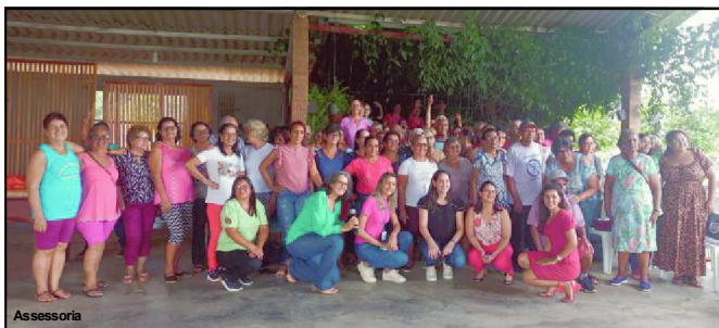
O dia cheio de alegria terminou com registro ilustrado da Assistência Social com o grupo da melhor idade