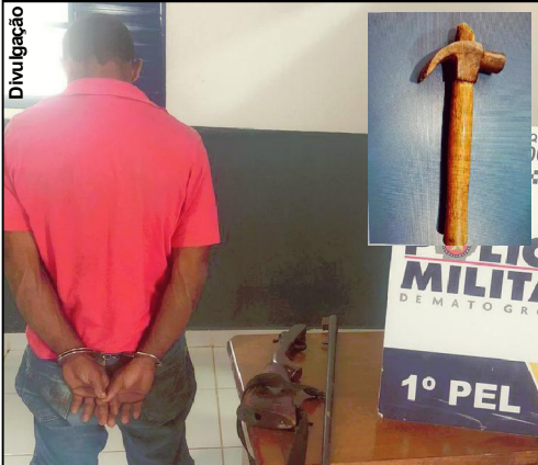
Bandido do martelo foi preso em flagrante por crime contra idoso

Alta Floresta/MT Um homem de 43 anos, foi transferido para a Cadeia Pública de Alta Floresta, depois de ser reconhecido e preso como autor de um roubo na zona rural do município de Paranaíta. A vítima é um idoso de 71 anos e o criminoso ainda o agrediu com golpes de martelo na cabeça do produtor rural, antes de sair levando seus pertences, entre eles, uma espingarda calibre 32.