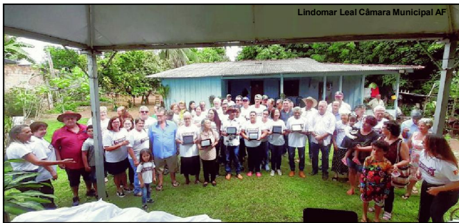
Vereadores com pioneiros do município de Alta Floresta

LINDOMAR LEAL Assessoria de Imprensa Câmara Municipal