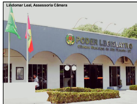
Câmara cobrou de concessionária providência em relação à problemas reclamados por consumidores