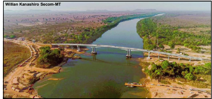
Ponte sobre o Rio das Mortes

Sempre inovando, o Governo de Mato Grosso também buscou soluções para resolver problemas que estavam fora de sua alçada. Para finalmente levar o asfalto até a região Noroeste de Mato Grosso, foi acertada a estadualização da BR-174 entre Juína e Colniza. Serão 271 quilômetros de asfalto novo e 23 pontes que vão