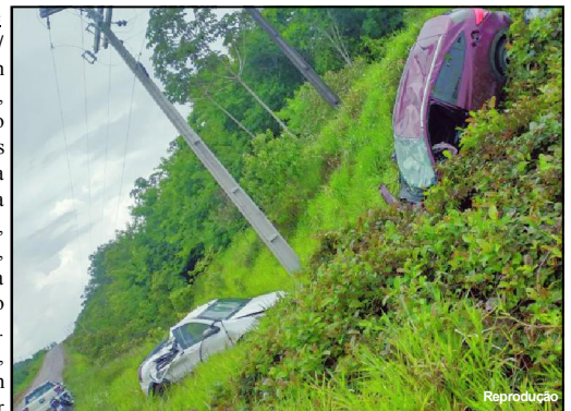
Carros ficaram destruídos no acidente na MT-206

Alta Floresta/MT – Um homem de 49 anos, resgatado pelo corpo de bombeiros de Alta Floresta após acidente na Rodovia MT-206, sentido Paranaíta, apresentou suspeita de fratura fechada no ombro superior. Pastor evangélico, ele dirigia um Honda-HR-V de cor vinho e capotou após um choque com um Fiat Pálio branco.