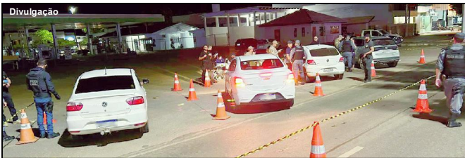
Operação resulta em veículos apreendidos e pessoas presas no centro de AF

Final de semana foi mais uma etapa das ações contra motoristas embriagados