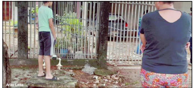
Vítimas agora estão com receio de permanecerem na mesma casa onde aconteceu o roubo

O pedreiro também lembra o momento em que deitou no chão de cabeça para baixo, juntamente com a esposa e filho, ficando os três sob mira de arma de fogo. “Queriam ouro ou dinheiro. Disseram que sabiam que a gente tinha, mas como, disse a eles”, contou a vítima que ainda está assustada. “Um momento que ninguém quer passar na vida e não desejo a nenhuma pessoa”, enfatiza.