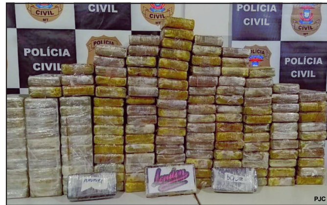
Droga apreendida pela Polícia Civil de Mato Grosso

No local, foram encontrados mais 104 tabletes de substância análoga a cocaína, totalizando 152 tabletes apreendidos. Questionado, o motorista disse que apenas carregou as drogas em Vilhena (RO), sem seguida carregaria o caminhão com algodão