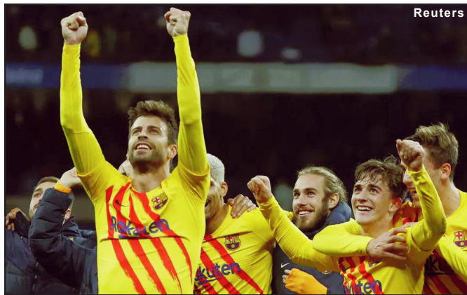
Jogadores do Barcelona comemoram vitória no El Clássico