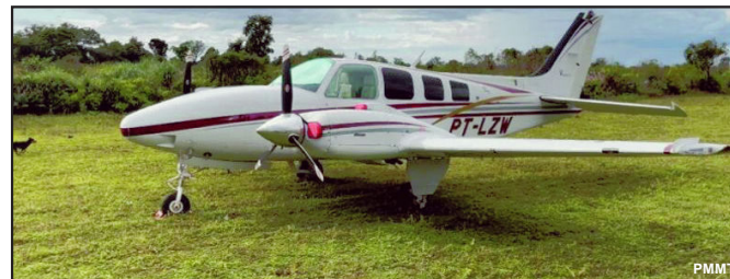
Avião que foi apreendido teria feito transporte de droga da Bolívia para o Brasil