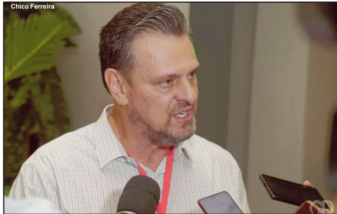
Senador foi denunciado por suspeita de caixa dois em sua campanha em 2018