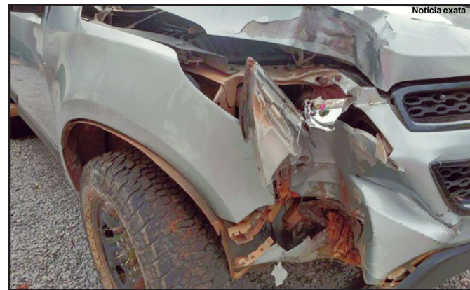
Veículo com danos materiais foi retido pela PM

também por envolver-se em um acidente após, conforme ocorrência, estar praticando “racha” com outro automóvel.