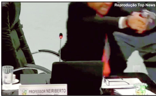
Momento foi de tensão na Câmara de Querência