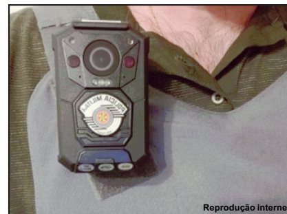
Policiais poderão usar câmeras em MT

Projeto foi interrompido a partir de pedido de vistas da bancada da segurança pública