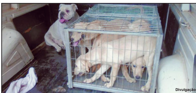
Cães foram resgatados e levados para outro local em Alta Floresta

Dono não foi encontrado, mas poderá responder criminalmente por maus tratos