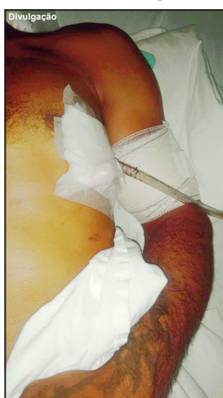
Garimpeiro alvejado permanece internado no Hospital Regional

Caso em Alta Floresta repercutiu em todo estado e outras regiões brasileiras