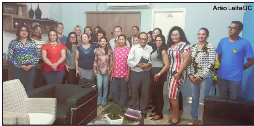
Candidatos a conselheiro em Alta Floresta

Escolas JVC e Benjamim Pádoa são os locais da votação que será das 8 às 17 horas