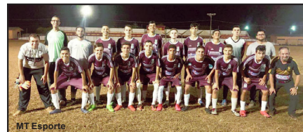
Equipe de Alta Floresta vai representar MT

garantiram o direito de representar Mato Grosso na competição após conquistarem de forma invicta, a fase estadual dos JIFMT realizada em Barra do Garças.