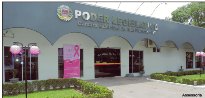
Poder Legislativo de Alta Floresta abraça bandeira contra o câncer

LINDOMARLEAL Assessoria de Imprensa Câmara Municipal