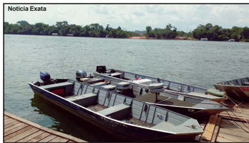
Embarcações serão regularizadas pela Marinha em AF