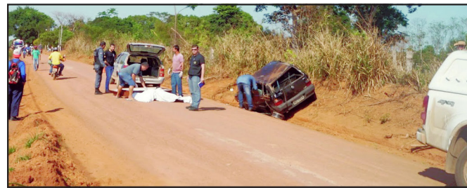
Evangélico que morava em Alta Floresta morreu no local

Tragédia aconteceu na madrugada de sexta-feira, 4 de outubro