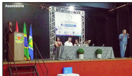
Evento realizado no Teatro Agostinho Bizinoto