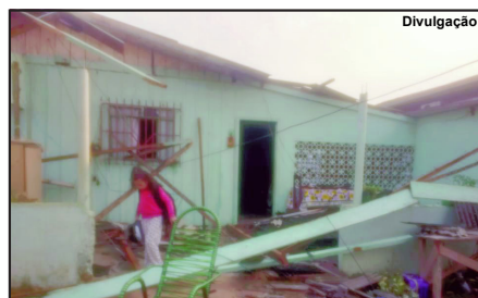
Família precisou se esconder durante temporal

danificadas, entre outros prejuízos no município de Alta Floresta. A imagem mais comum na manhã de segunda-feira era de destroços pelas ruas e muita gente cuidando dos reparos, limpando a sujeira deixada pela chuva que chegou forte, carregada de muito raio, trovão, vento e até granizo.