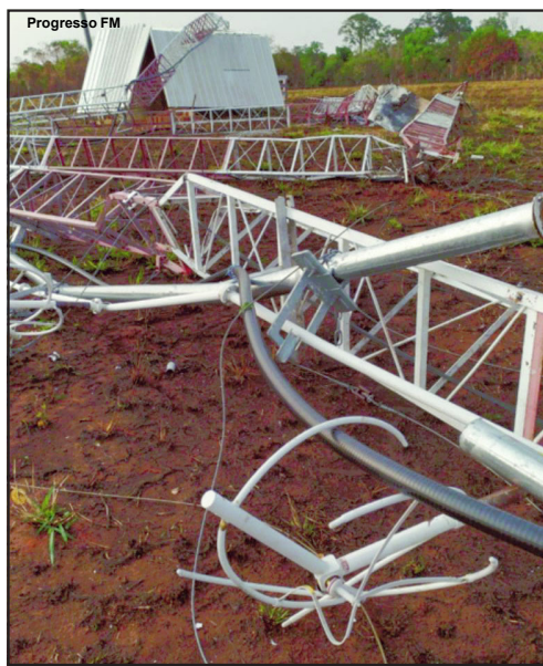
Torre de transmissão foi ao chão na noite de domingo

Prejuízos até agora são contabilizados pela empresa do Grupo Rio da Mata