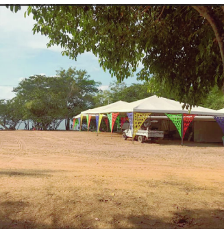
Em Paranaíta Marinha cancela festival de pesca

Se em Alta Floresta várias embarcações foram apreendidas e balsa interdita, na cidade de Paranaíta, região do conhecido Cajueiro a situação foi também de muitas reclamações, polêmicas, mas com autuações da marinha do Brasil que cancelou no domingo, a realização do 16º Festival de Pesca. Dezenas de embarcações e equipes já