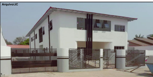
Nova sede da Delegacia Municipal de Polícia Judiciária Civil de Alta Floresta

Mudança começou nesta segunda-feira para novo prédio na Rua D-4, centro