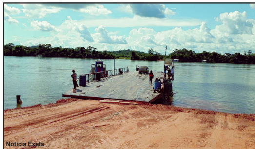
Balsa no Porto de Areia, MT-325, Rio Teles Pires, em AF