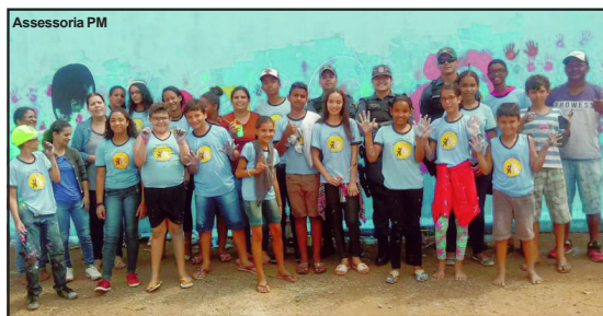
Alunos da Escola Geny Silvério com militares

Marcos José / Abraão Lincoln / Assessoria PM