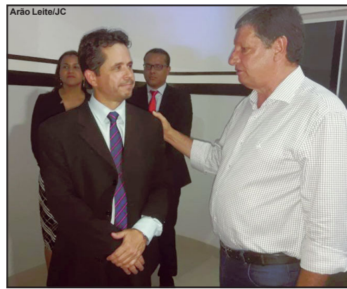
Delegado geral da Polícia Civil e prefeito de Paranaíta

aproveitou o momento para fazer comentários, destacando o tamanho e estrutura da nova Delegacia de Alta Floresta e ainda oferecendo apoio. “Nós em Paranaíta, sempre que formos procurados e pudermos ajudar, estamos prontos. Digo isso não apenas para a Polícia Civil, mas à Polícia Militar, Corpo de Bombeiros e outras instituições”, assegurou.