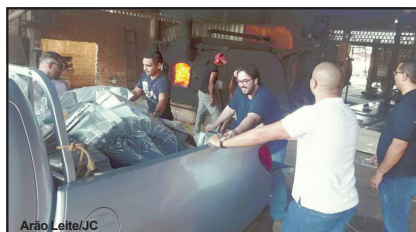
Incineração ocorreu nesta quarta, 25

Foram dezenas de volumes, jogados aos poucos, dentro do forno gigante. Antes no entanto, tudo foi conferido novamente por Polícia Civil