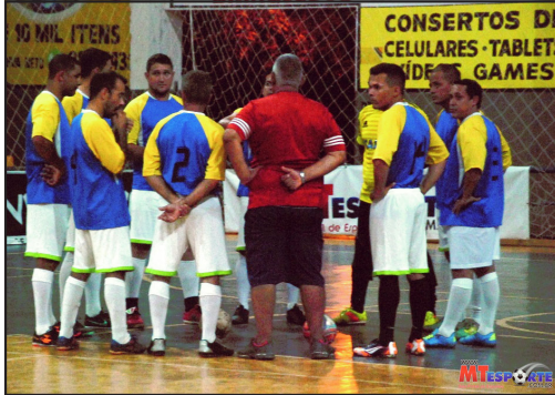
Funcionários públicos bastante envolvidos na competição

No outro jogo da noite, empate em 1 a 1 entre as equipes da Agricultura x Saúde. Os gols foram mar-