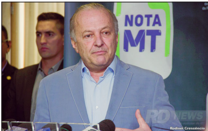
Governador em exercício Otaviano Pivetta, durante coletiva à imprensa no Palácio Paiaguás