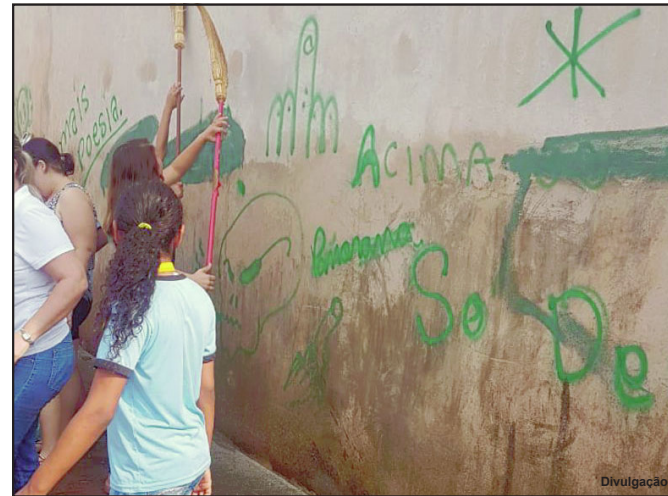
Essa imagem do muro pichado agora só mesmo em foto

A gincana realizada pela Escola Geny Silvério foi abraçada pelos alunos que pintaram muros, cataram lixo, plantaram árvores e desenvolveram outras atividades, dando exemplo de educação e conscientização. O projeto,